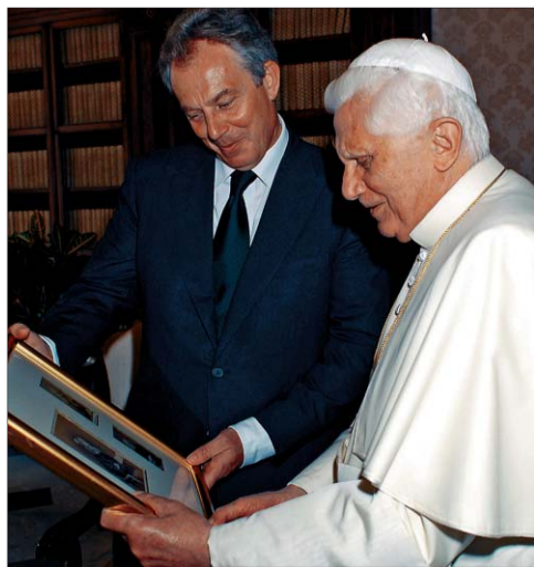
Blair regala al Papa, ayer, tres fotos del cardenal Newman.

El Ejecutivo hizo nuevas ofertas tras el atentado de la T-4, pero la banda le exigió un compromiso de cambiar las leyes para lograr la autodeterminación del País Vasco y Navarra. Pág. 15