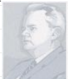
El Presidente Serbio Slobodan Milosevic fue acusado de crímenes contra la Humanidad

Según este plan Serbia se pliega a las exigencias y acepta la entrada en su territorio de fuerzas de la OTAN y rusas. En Kosovo, además, hay una presencia en misión civil de la ONU.