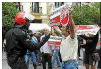
Un grupo de 'abertzales', ayer.

Hacienda investiga a millonarios y grandes empresas por ocultar como 'leasing' la compra de aeronaves