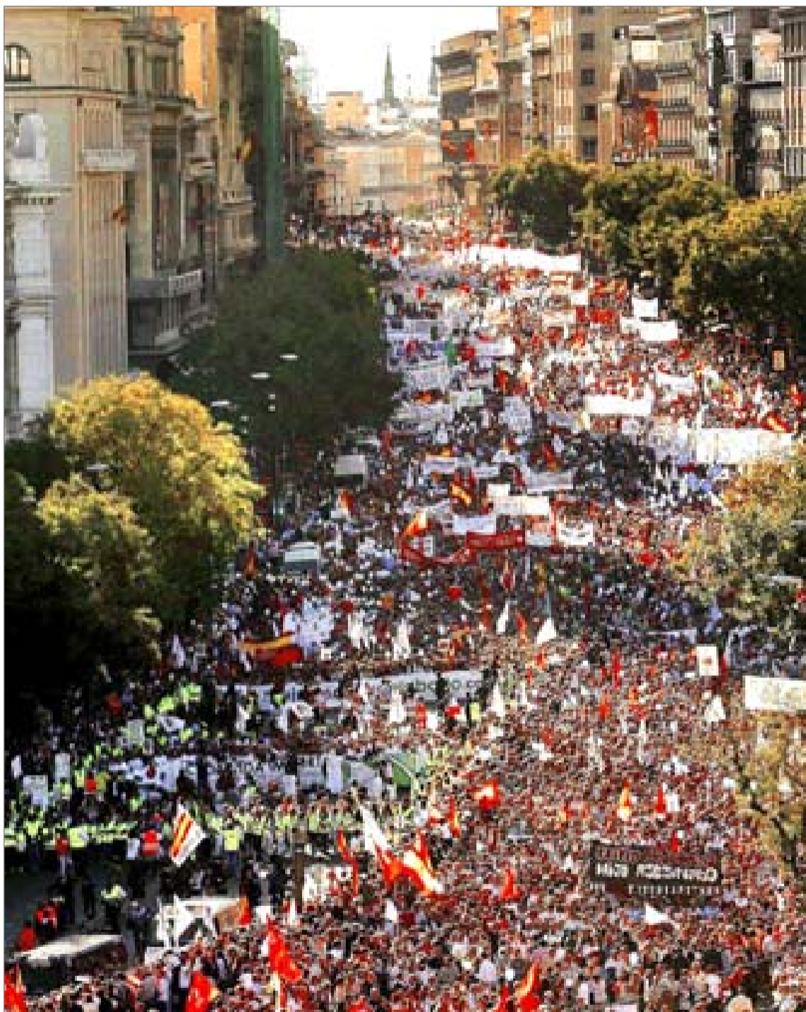
La madrileña calle de Alcalá, atestada de gente, ayer durante la manifestación en contra de la nueva Ley del Aborto.

Así lo atestiguaron las pancartas, muchos asistentes, los lemas y hasta el manifiesto final leído por el presidente del Foro Español de la Familia, Benigno Blanco. Sigue en página 4 Editorial en página 3