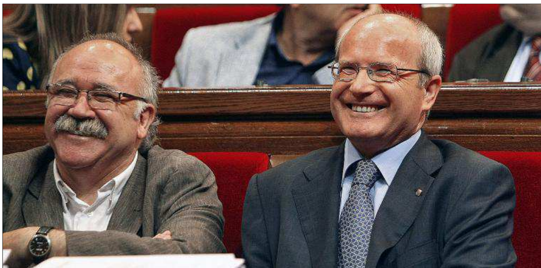
El vicepresidente y el presidente de la Generalitat, Josep Lluís Carod-Rovira y José Montilla, ríen durante el debate celebrado ayer en el 'Parlament'.

Raúl, el '7' del Schalke 04: «Ojalá juegue contra el Real Madrid» / Página 38