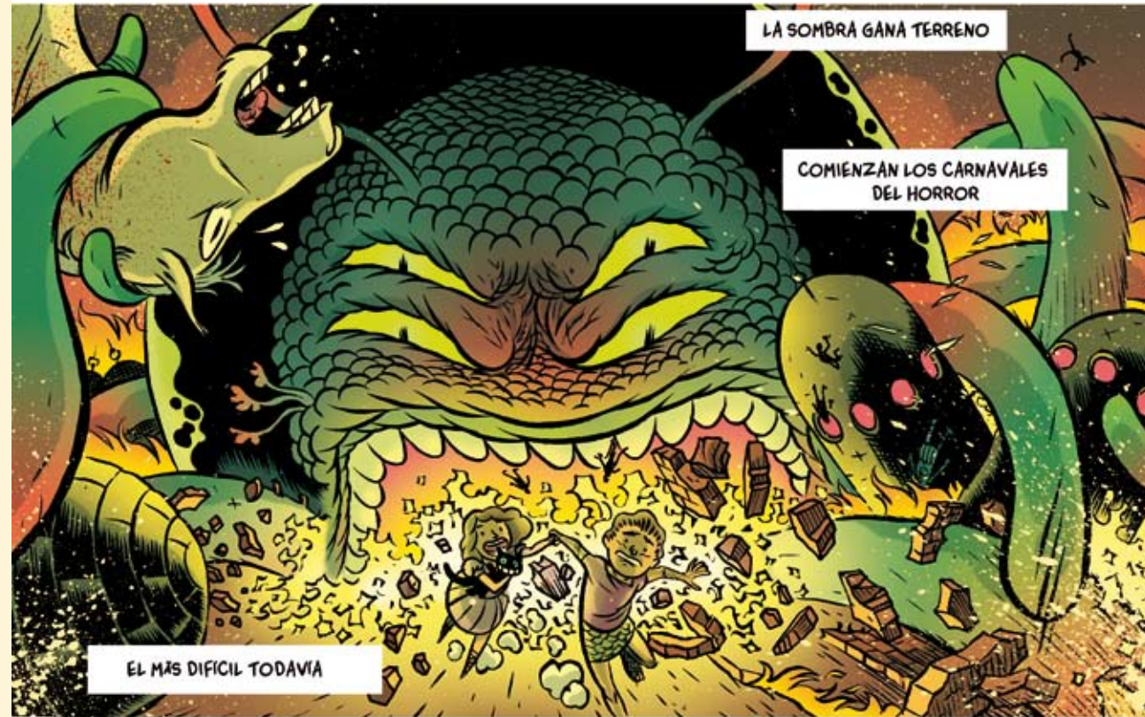
LA SOMBRÁ GANA TERRENO