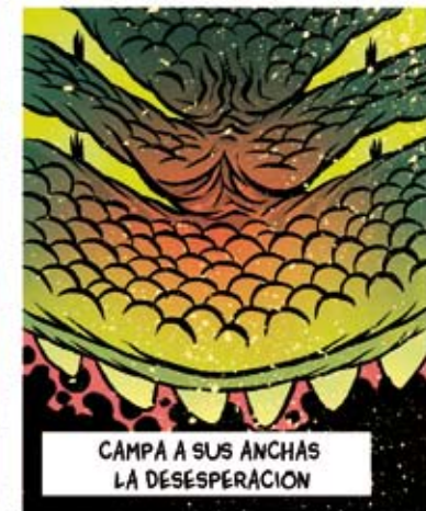
CAMPA A SUS ANCHAS LA DESESPERACION