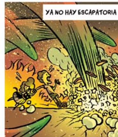
YA NO HAY ESCAPATORIA