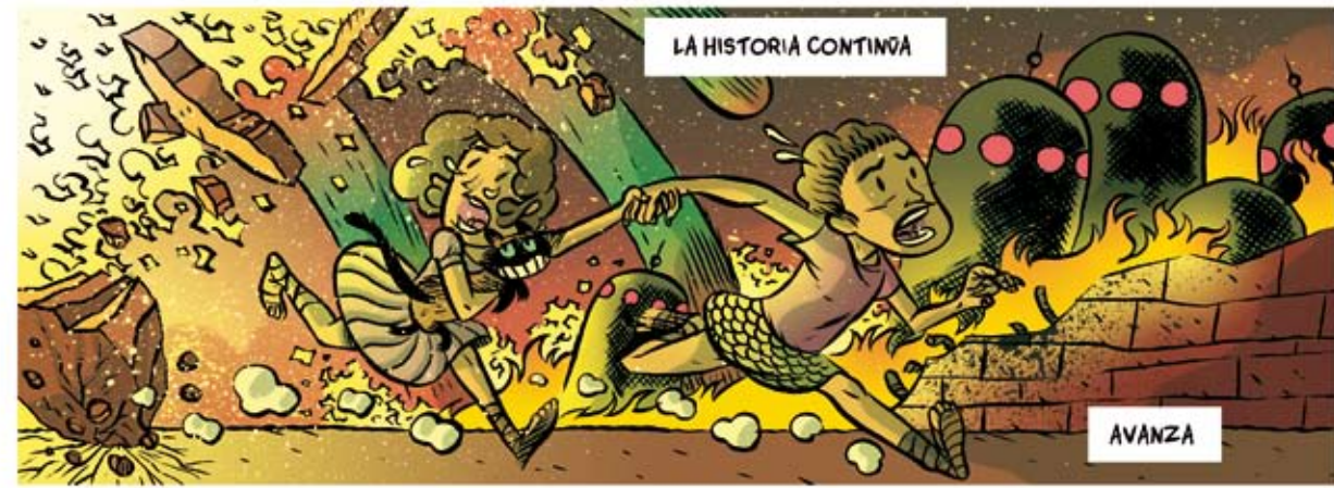
LA HISTORIA CONTINUA