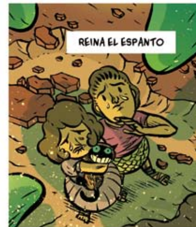
REINA EL ESPANTO