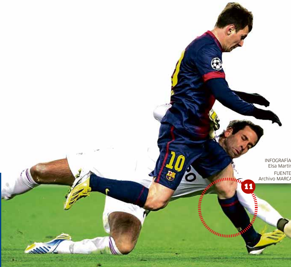
INFOGRAFÍA: Elsa Martín

Temporada 2012-2013 Artur cae con todo su peso sobre la rodilla izquierda de Leo. El resultado del percance es una simple contusión.