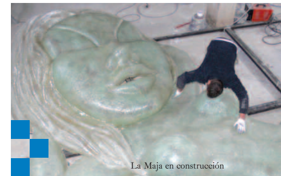
La Maja en construcción

La compañía de la coreógrafa Sol Picó recrea un espectáculo en tan emblemática plaza utilizando siempre a Goya como referente. Una puesta en escena donde la danza contemporánea se conjuga con los movimientos de grandes marionetas y la música popular interpretada por la Banda Primitiva de Alcoy. Daoíz y Velarde serán testigos de las andanzas, amores y traiciones de la Maja Desnuda, la Bestia y de Manolita Malasaña. “La gigante” de Manolita baila con un grupo de modistas y se enfrenta a la “Bestia” recogiendo parte de la leyenda que circula sobre la joven heroína.